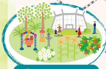
グリーンセンター