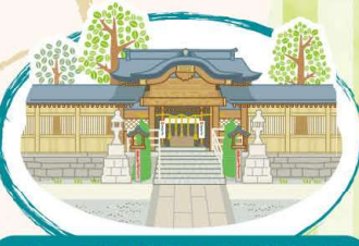
鳩ヶ谷総鎮守 氷川神社