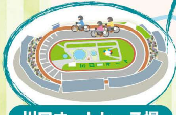
川口オートレース場