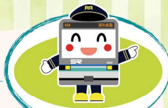
浦和美園 たまさぶろう