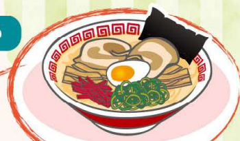
ラーメン激戦区 東川口