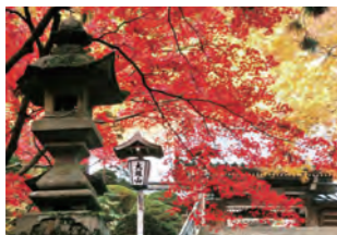
アクセス 伊豆箱根鉄道大雄山線 大雄山駅下車バス10分

天狗伝説がある境内には、さまざまな天狗様や世界一といわれる天狗の高げたがおさめられているよ。