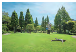
アクセス 箱根登山鉄道 彫刻の森駅下車徒歩2分 開館時間9:00~17:00(入館は16:30まで)

国内ではじめての野外美術館で、箱根の山々が望める庭園には世界を代表する芸術家の名作が展示されているよ。