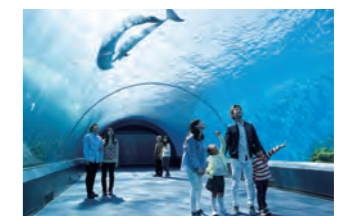
アクセス 横浜シーサイドライン 八景島駅下車すぐ

水族館やアトラクションなど、おとなから子どもまで1日中楽しめる空間が待っているよ。