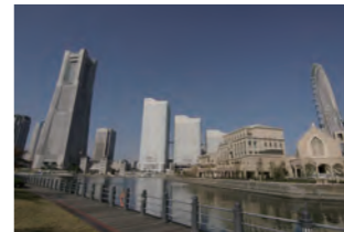
アクセス みなとみらい線 みなとみらい駅下車

グルメやショッピング、海風をかんじられる公園など都市型観光スポットとして楽しめるよ。