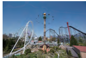
アクセス 富士急行 富士急ハイランド駅下車

園内には世界記録に認定された世界一のアトラクションがたくさん。絶叫マシンでもりあがろう。