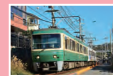
アクセス 江ノ島電鉄 江ノ島駅下車徒歩21分

このエリアには楽しい見どころがいっぱい! 駅を巡り、スタンプをGETしながら楽しもう!