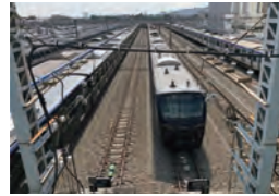
アクセス 相鉄本線 かしわ台駅隣接