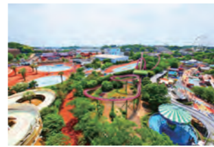
アクセス 小田急線 読売ランド前駅下車バス10分 開園時間10:00~17:00、9:00~20:00など

大迫力のジェットコースター「バンデット」やけしきがい大観覧車など、数々のアトラクションが楽しめるよ。