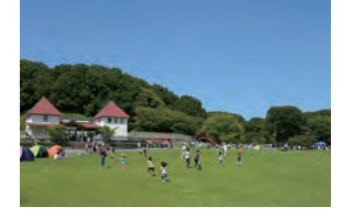
アクセス 東急こどもの国線 子どもの国駅下車 開園時間9:30~16:30(入園は15:30まで)

かわいい動物たちとふれあうことができるよ。全長110メートルある長いローラーすべり台は親子で楽しめるよ!