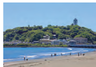
アクセス 江ノ島電鉄 江ノ島駅下車徒歩21分

江島神社や江の島シーキャンドル(展望灯台)、いそそびなどのスポットがたくさんあるよ。