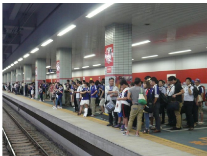
ホームドア設置前