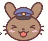
うさぎ駅長「ラビたま」

平日夜に浦和美園駅発着の東京メトロ南北線 直通列車を下り 4 本・上り 4 本増発します！