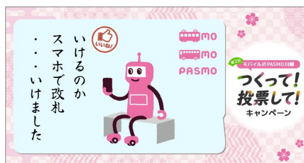
(川柳カード画像イメージ) ※本作品は前回の最優秀受賞作です