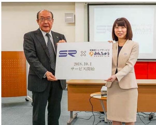
《当社社長とアイキューソフィア中野社長会見の様子》