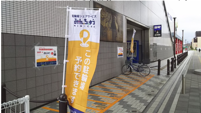
【浦和美園駅東口みんちゅう駐輪場】

「みんちゅう SHARE-LIN」はスマートフォン等を利用していつでも誰でも駐輪スペースを予約し借用することができる駐輪場シェアサービスです。