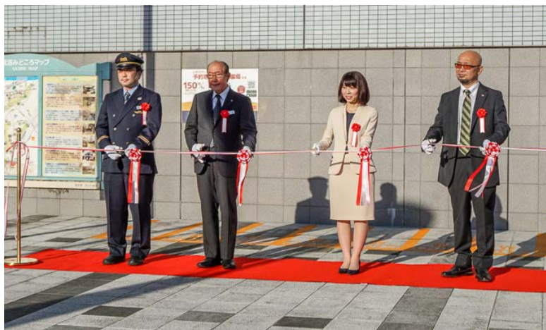
《浦和美園駅西口みんちゅう駐輪場の開始式》