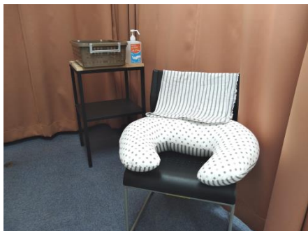
川口元郷駅授乳スペース内（備品はイメージです）