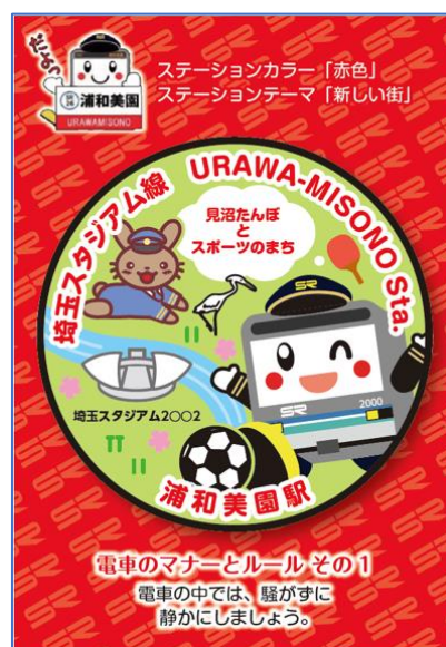
宝箱の中から 手に入るシール一例