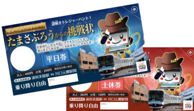
【おとくなきっぷ「たまさぶろうからの挑戦状」】