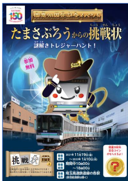
リーフレット表紙

埼玉高速鉄道 運輸部旅客課（048-878-6855 平日 9:00～17:45）