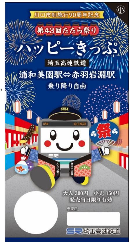
《第43回たたら祭りハッピーきっぷ》