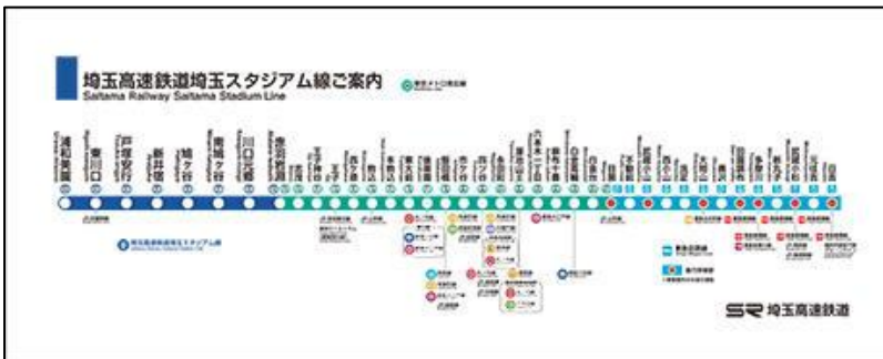
「路線図タオル(イメージ)」