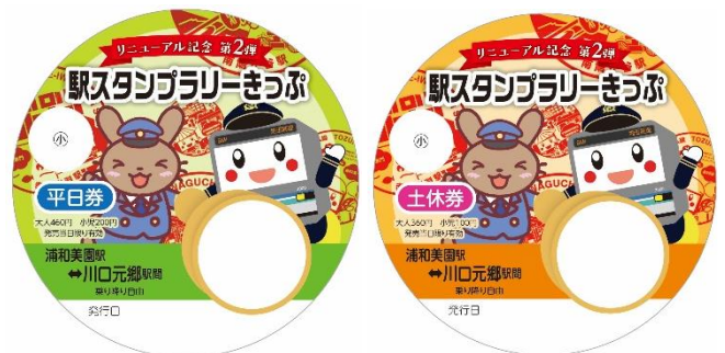
「第2弾 駅スタンプラリーきっぷ」