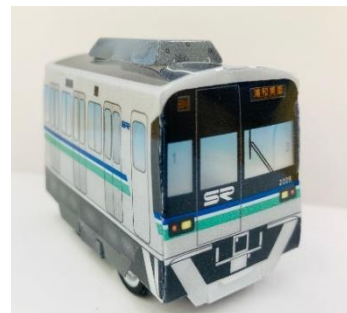
「組立プルバック電車(イメージ)」