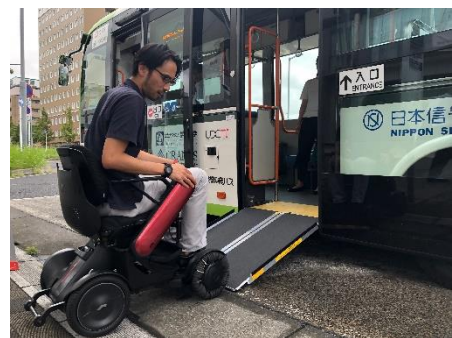
自動運転バス実証実験時

※同意書へのご記入、公的身分証明書をご提示いただきます ※浦和美園駅から鉄道にはご乗車いただけません