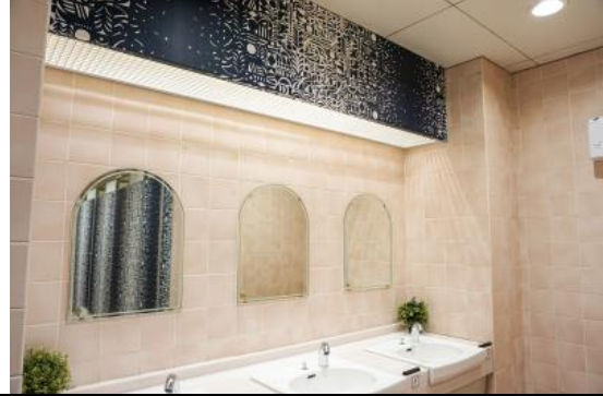
南鳩ヶ谷駅 女性用