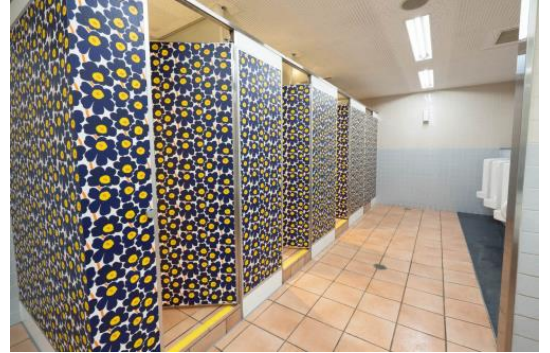
浦和美園駅 男性用 (リニューアル済み)