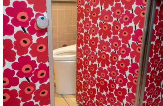
浦和美園駅 女性用 (リニューアル済み)