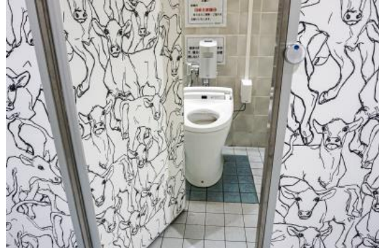
南鳩ヶ谷駅 男性用