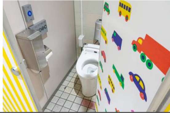
戸塚安行駅 女性用