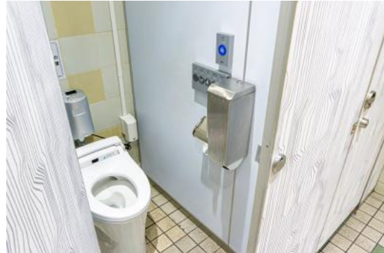
戸塚安行駅 男性用