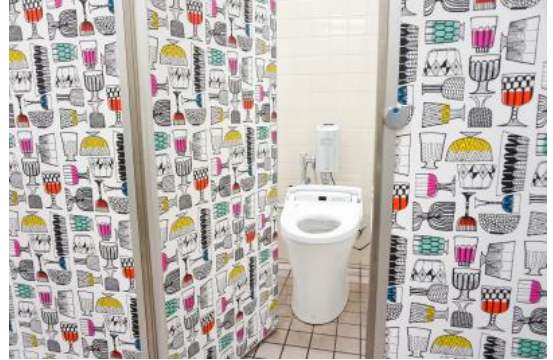
川口元郷駅 女性用