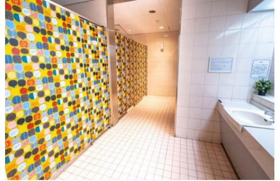
東川口駅 女性用 (リニューアル済み)