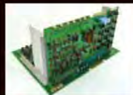
『スペースインベーダー』 アップライト筐体基盤