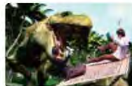
[常設展] 合成映像体験