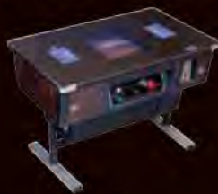
『スペースインベーダー』 (1978年/タイトー) ©TAITO CORPORATION 1978 ALL RIGHTS RESERVED.

デジタルゲーム史上最大のヒット作『スペースインベーダー』と「もっとも成功した業務用ゲーム機」ギネス認定『パックマン』の実際のゲーム機がプレイ可能。開発者のインタビューや貴重な開発資料も展示します。