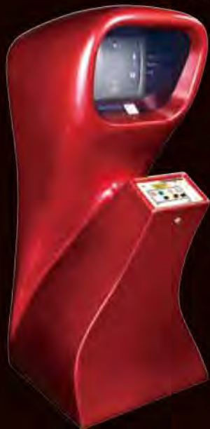
アーケードデジタルゲームの元祖 『コンピュータースペース』 (1971年/ナッチング・アソシエーツ)