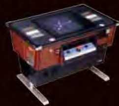
『パックマン』 (1980年/ナムコ) ©BANDAI NAMCO Entertainment Inc.