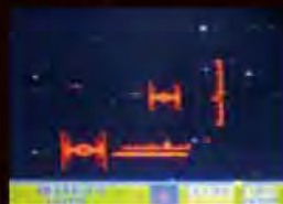
『スターファイヤー』 (1978年/エキシディ)

デジタルゲームが動くしくみや使用されている映像技術について、実際のゲーム機を題材にわかりやすく解説します。