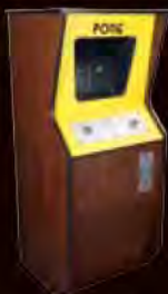
史上初の大ヒット作 『ポン』 (1972年/アタリ)