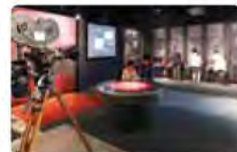
[常設展] 映像のしくみ