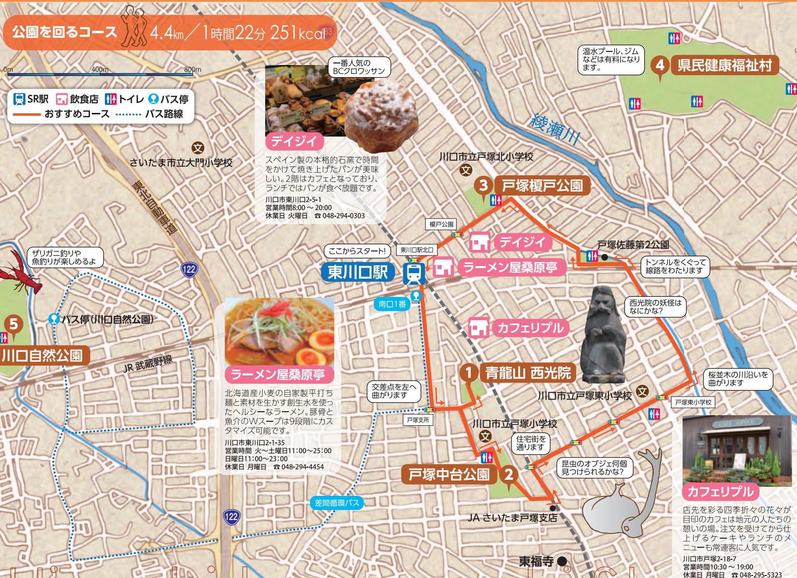
一番人気のBCクロワッサン