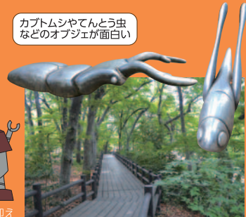
カブトムシやてんとう虫などのオブジェが面白い

クワガタやテントウムシなど昆虫のオブジェが迎えてくれる高台の公園です。雑木林や芝生広場が広がっており、テニスコートやジョギングコースもあります。