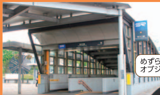
めずらしい オブジェが印象的

JR武蔵野線との乗換駅で乗降人数が最多です。駅前にはトンネル掘削時に使用されたシールドマンの Cutterヘッドのレプリカが展示されています。