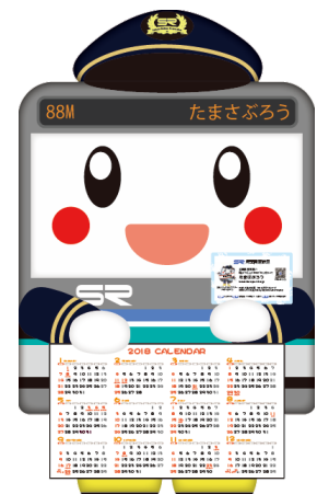
《カレンダー台紙》 縦60.0cm×横33.6cm